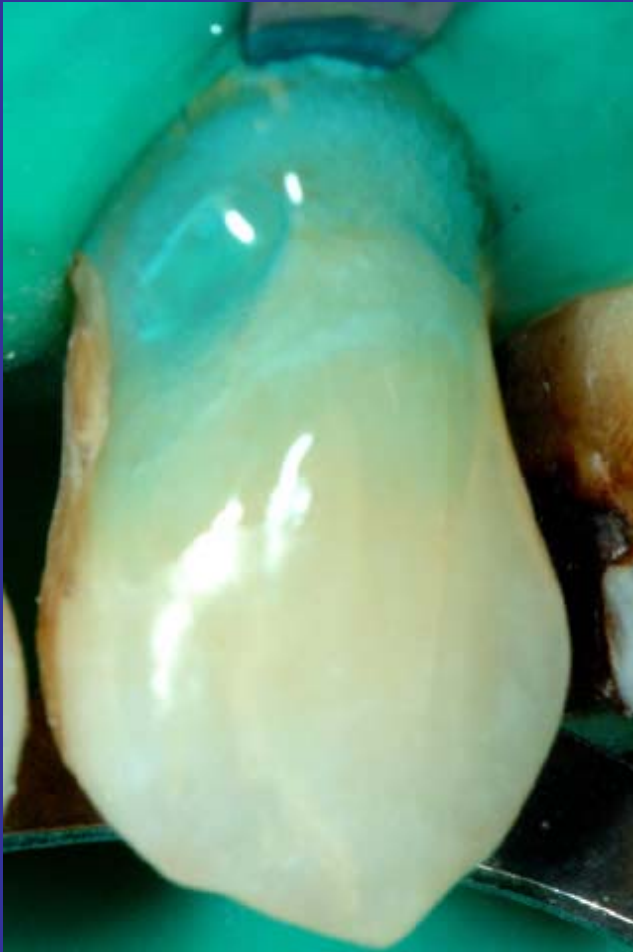
Aplicación de ácido

La aplicación del ácido, debe ir más allá de los límites previstos para la restauración.