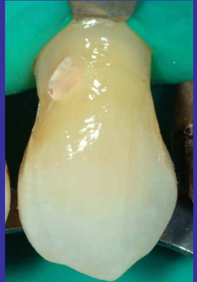
Aplicación de adhesivo

Puede usarse dos o tres capas de adhesivo cuando su solvente es en base a etanol, cuando es en base a acetona, se sugiere sólo una.